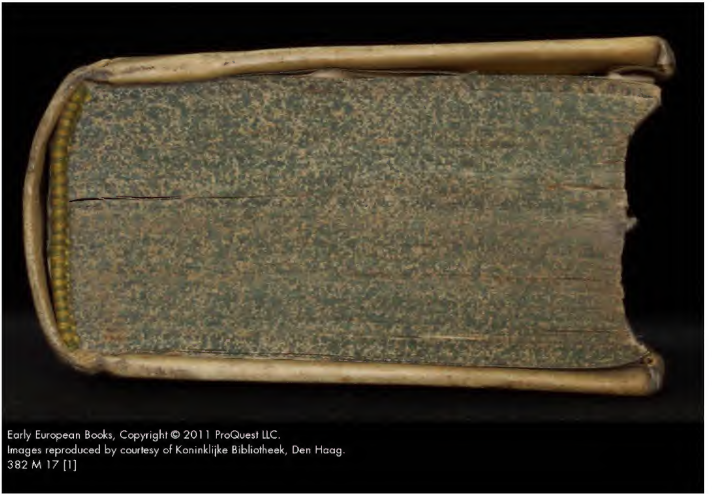
382 M 17 [1]